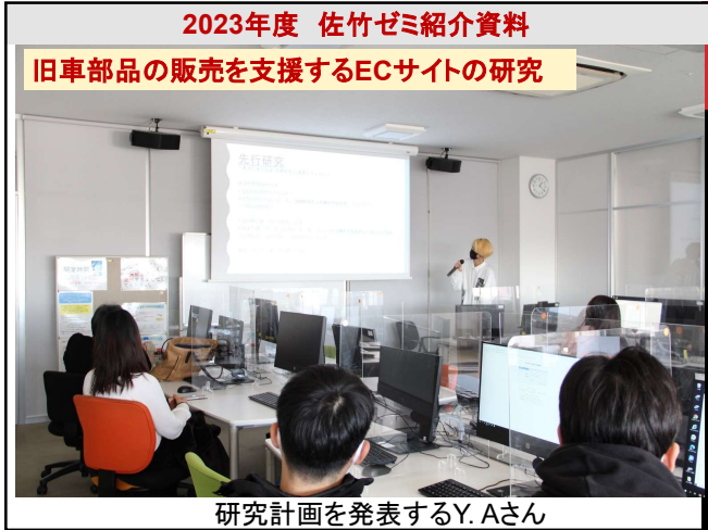
2023年度 佐竹ゼミ紹介資料